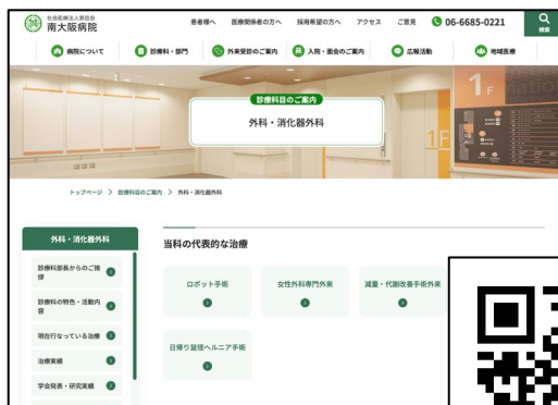
外科・消化器外科